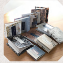
豆本と革 トノエル 3日