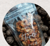
Love it 3・4日