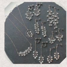
mili pua & SUZU 3・4日