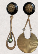
elly accessory 3日