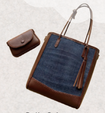
Belle Saison 3・4日