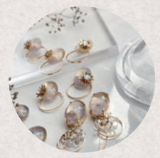
Classy accessories 3・4日