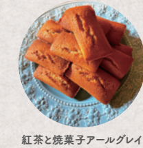
紅茶と焼き菓子アールグレイ 3・4日