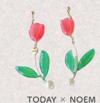
TODAY × NOEM 4日