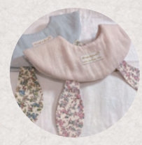
Baby closet 3・4日