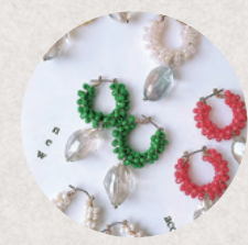
The Autumn 3・4日