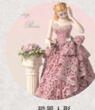
磁器人形 アトリエ Miory Rose 3・4日