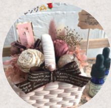
アロマストーン雑貨のお店 Lumierise/ルミエリゼ 3・4日