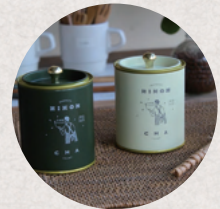
チャボさんのお茶 3・4日