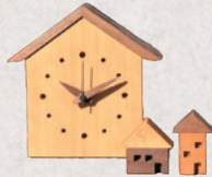
木工房カフージュ 3・4日