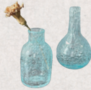
kapuri glass 3・4日