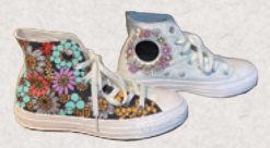
イラストスニーカー 4日