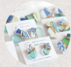
full moon 3日