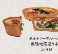
タルトリーアルペール 菓鴨地蔵通り本店 3・4日