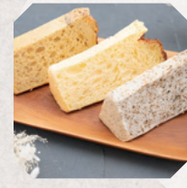
ゆうたんのほったた 3・4日