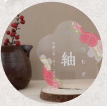
m.gift shop 4日