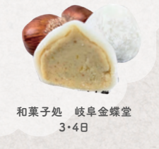
和菓子処 岐阜金蝶堂 3・4日