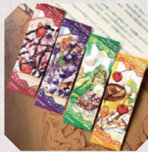
くまさんのアトリエ 3日