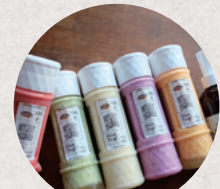
Sauce Mania 3・4日