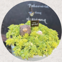
peu a peu 3・4日