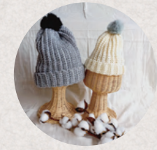
nana * hime /usamimiribbon 4日