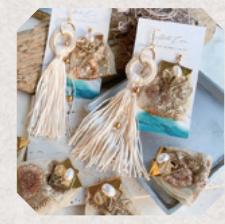
Aloha Coco 4日