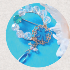
BLUE BEAR 3・4日