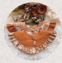
mahina made 4日