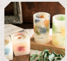
Vau Candle 4日