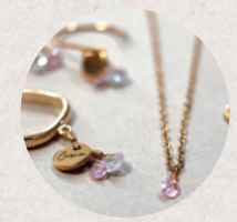
Alumno / Carmen. by Alumno 3・4日