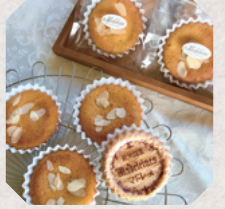
おやつ工房 歩々 3・4日