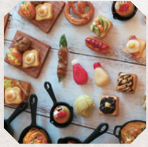
いしのフェイクフード製作所 3日