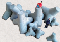
くまごころ ねこしらず 3・4日