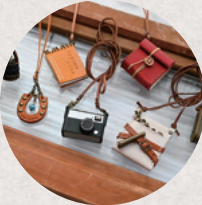
ron ron 4日