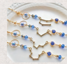
深海層プラネタリウム 3・4日