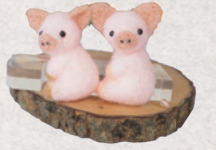
豆くまフェルト工房 4日